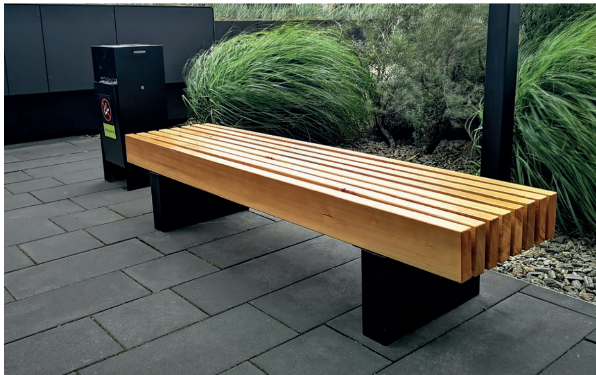
Cette image est illustrative et peut ne pas exactement reproduire le produit décrit.